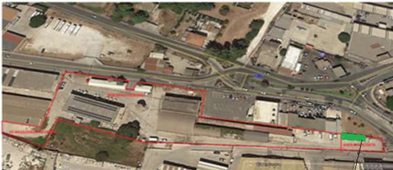
Area di ingombro deposito e pensilina