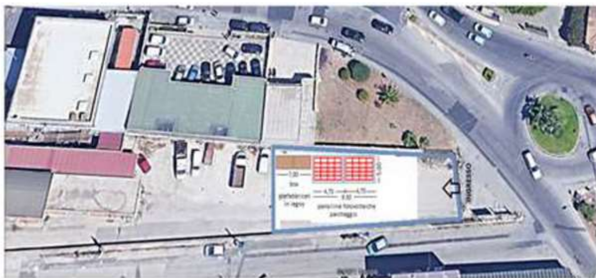
Planimetria dell'area interessata all'intervento