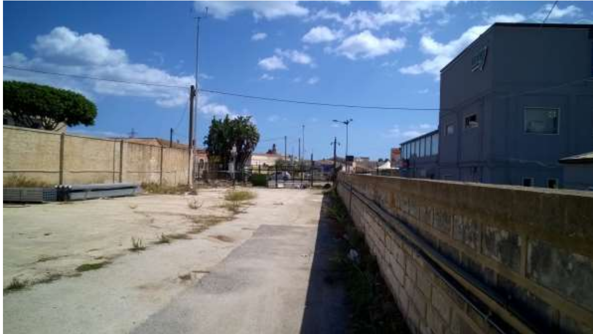
Area in oggetto